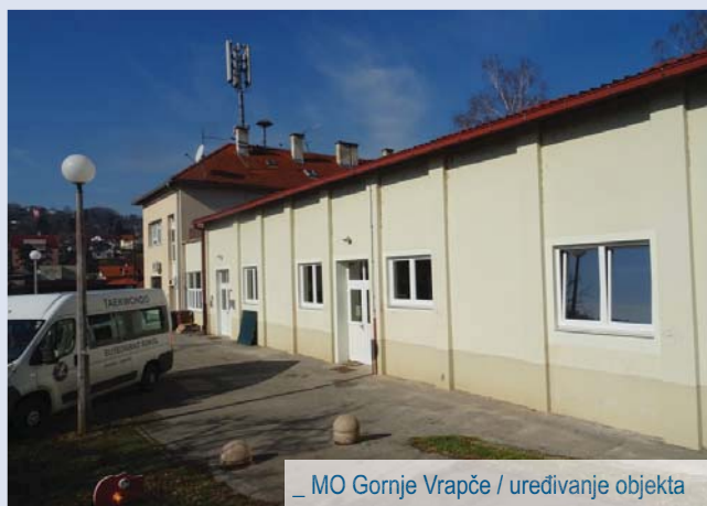
_ MO Gornje Vrapče / uređivanje objekta