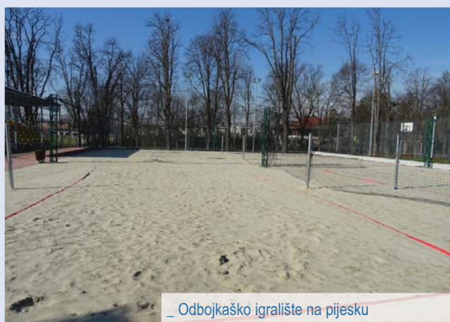
_ Odbojkaško igralište na pijesku