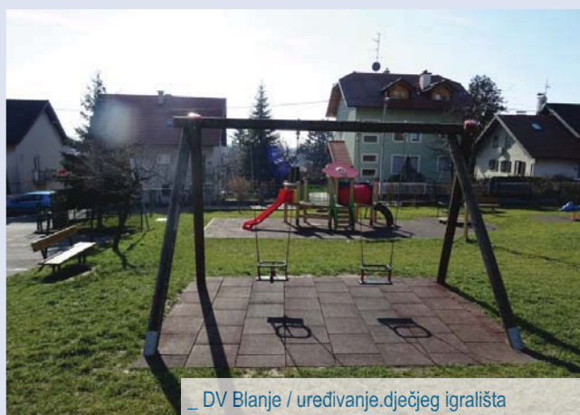
_ DV Blanje / uređivanje dječjeg igrališta