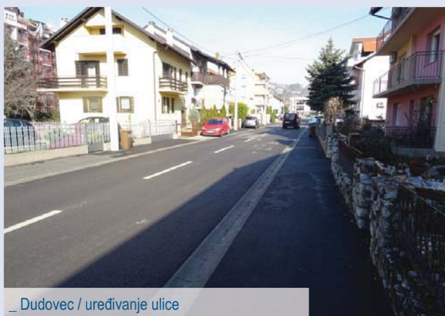
_ Dudovec / uređivanje ulice