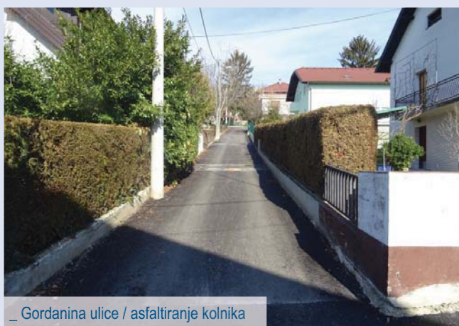
_ Gordanina ulice / asfaltiranje kolnika