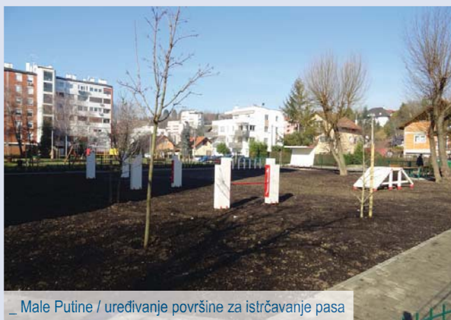
_ Male Putine / uređivanje površine za istrčavanje pasa